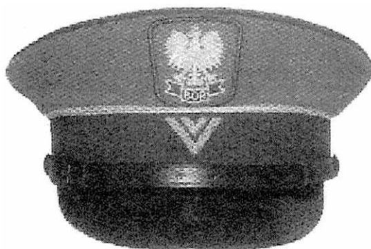
e) czapka wyjściowa podoficera w stopniu starszego sierżanta