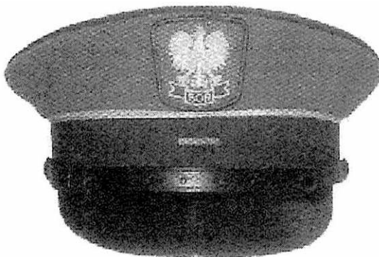
f) czapka wyjściowa szeregowego w stopniu starszego szeregowego