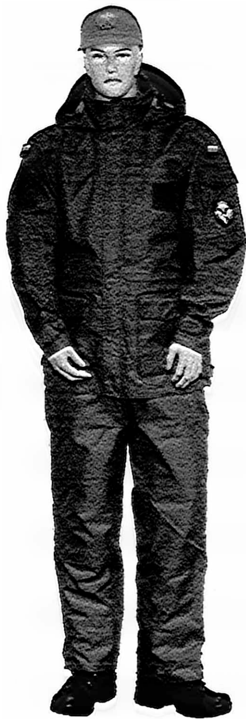
c) Ubiór polowy funkcjonariusza z kurtką i spodniami ubrania ochronnego